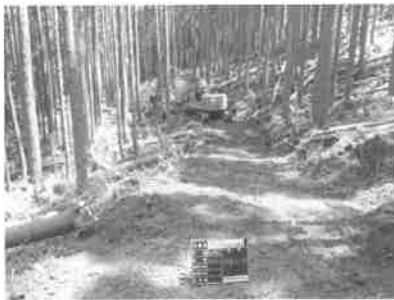
写真-2 森林作業道の作設状況

作設経費は、地山傾斜等によるが支障木の伐採も含め2,000円/m前後となっている(写真-2)。