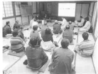
写真-1 集約化施業提案説明会の状況