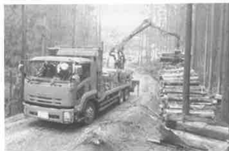
写真-5 林道で積込むトラック(工場直送)