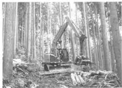
写真-3 プロセッサによる造材状況

最近では、大型製材工場との提携や木質バイオマス発電の稼働で未利用材に付加価値が生まれた。プロセッサの導入により、これま