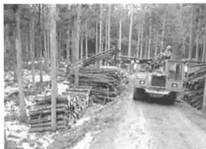
写真-4 フォワーダによる林道への搬出状況